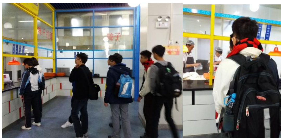
我们冲冲忙忙地排队吃早餐

今天是我们第一天跟西安交大附中分校的学生们一起上课。吃了早餐以后，我们搭了 45 路巴士到学校去。在那里集合之后，张校长就安排接待我们进入每个班级的伙伴，到他们的课室去上课。学生们都很积极的邀请我们，对我们很友善。一踏进课室门口，从他们的接待就能感受到他们的温暖。上了两节课之后，我们回到了原本的课室，开始上专题课。我们在专题课上学到了西安的历史，不同的诗歌，还练了一些武术。武术课最特别的地方就是我们学怎么用扇子来练武。忙了一整天，我们就回到了宿舍吃了丰富的晚餐，过后也就回房休息了。