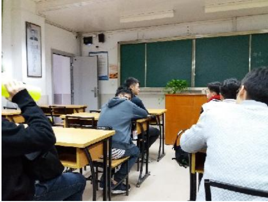
在课室里休息准备上课