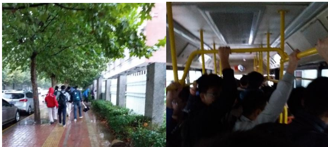
走到巴士站搭 45 路巴士