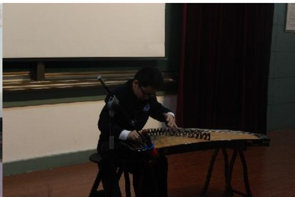
( 交大附中学生琵琶表演 )