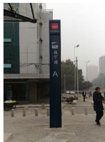
( 咸宁路站 )

过后，我们从浐灞欧亚中学附近的地铁站搭了地铁到交大附中附近的咸宁路站，又搭了公交车到交大附中门口。