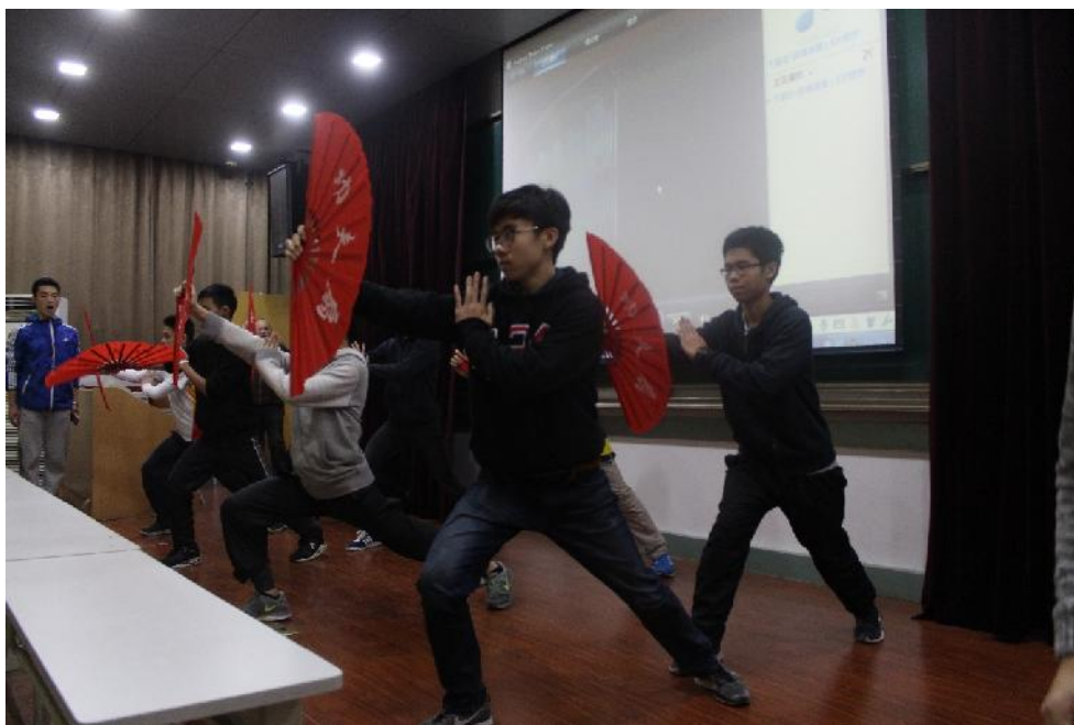
( 功夫扇武术准备过程 )

我们接下来就开始了毕业典礼的准备。同学们在毕业典礼准备时练习了武术拳，优秀的专题作业呈现和很多不同项目。