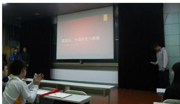
( 专题作业呈现 )

毕业典礼过后，我们有自由时间与交大附中的学生们做最后一次交流。我们最终还是要与这一个月来所交的新朋友们告别。虽然我们相处的时间不长，但我们已经建立了深深的友谊，非常不舍得离开。再见交大附中，再见西安，我们永远不会忘记在这里的美好经历！