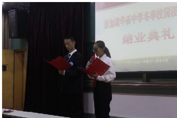
( 交大附中学生发言 )

我们过后看了交大附中与华中双方的精彩表演与发言。交大附中的表演项目包括琵琶表演与舞蹈表演，而华中贵做了武术表演与专题作业呈现。