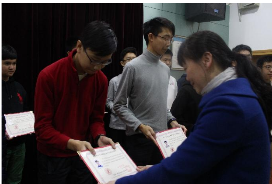
( 颁发毕业书 )