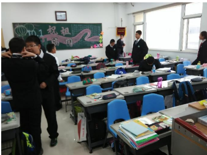
（浐灞欧亚中学的课室里）