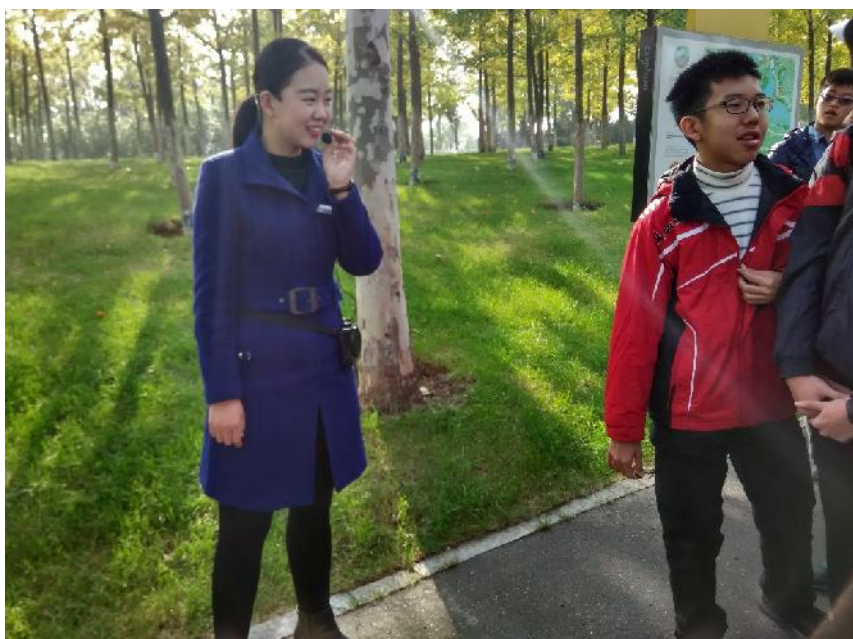
（带领着我们的讲解员）