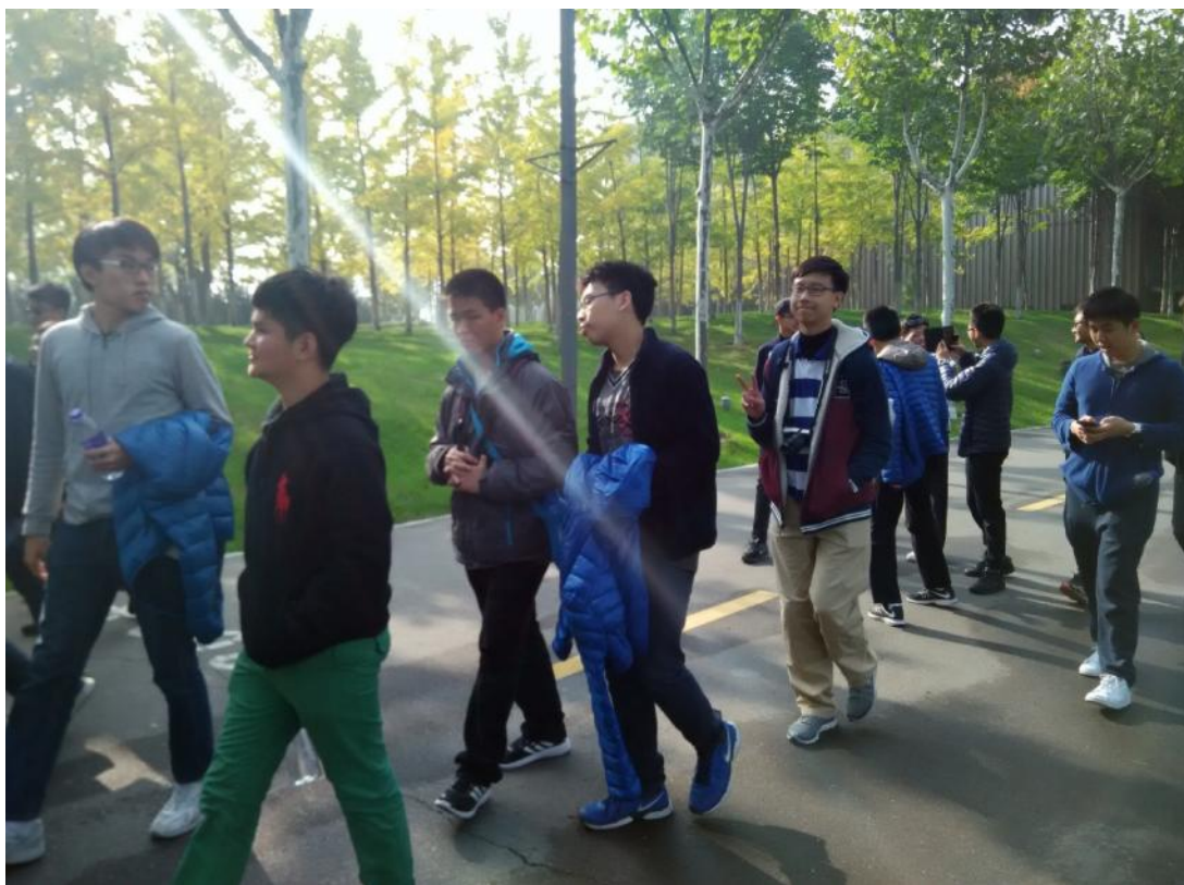
（同学们在欣赏美丽的风景）

参观完了浐灞区城建博物馆，我们又去了西安世园会。我们在那里能看到美丽的风景和花草树木。我们在那里的自然馆学到很多不同的植物，也在那里的长安塔学到了中国历史。