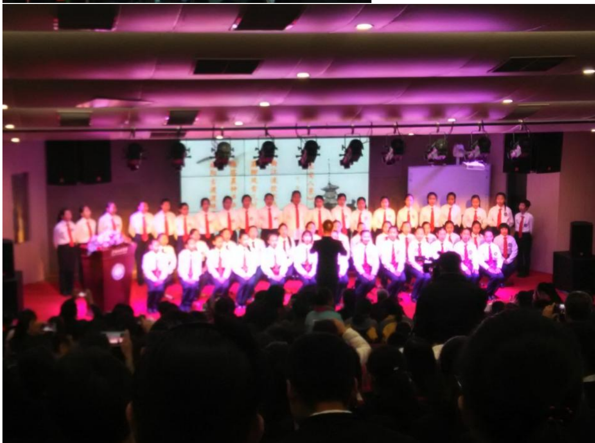
（颁奖典礼的精彩表演）